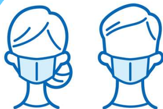
スタッフのマスク着用