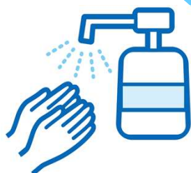
アルコール消毒の徹底