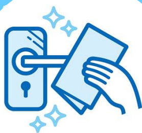
接触部の消毒の強化 3)